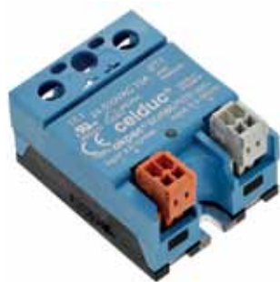
Рис.9. ТТР серии SOR