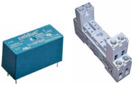
Рис.4. ТТР серии ST и кронштейн для его установки на DIN-рейку

Серия SP-ST – это стандартные реле двух габаритов, сочетающие в себе доступность и широкие возможности по доработке (рис.4). Коммутируемые ток и напряжение серии SP-ST: до 4 А/12...275 В переменного тока и до 5 А/0...68 В постоянного тока; управляющее напряжение: 15...30 В переменного тока или 4...16 В/12...30 В постоянного тока (или сочетание двух вариантов), габариты: 29×12,7×15,7 мм или 29×12,7×25,4 мм.