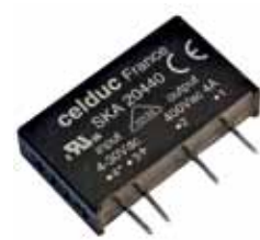
Рис.6. ТТР серии SKA для пайки на печатную плату

Линейки реле SKA/SKB/SKH/SN8/SHT, включающие в себя устройства для монтажа на печатные платы (рис.6), позволяют разработчику, в зависимости от решаемой задачи, быстро подобрать нужный вариант: