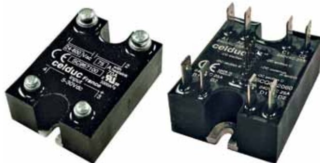
Рис.10. ТТР серий SC и SCQ

пенью защиты IP20 (без возможности касания токопроводящих узлов), обеспечивают простой монтаж проводов посредством винтовых терминалов. Основные характеристики реле серий S07/S08/S09: коммутируемые ток и напряжение до 125 А/24...690 В переменного тока; управляющее напряжение 3...32 В постоянного тока или 20...265 В переменного тока, либо сочетание этих вариантов; габариты 45×58,5×30 мм.