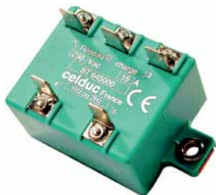
Рис.14. ТТР серии ST6

Помимо однофазных, практически все линейки реле celduc® relais содержат двух- и трехфазные