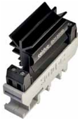
Рис.5. ТТР серии ХК с радиатором, установленное в кронштейн для монтажа на DIN-рейку

ТТР для цепей управления серии ХК специально разработаны для таких нагрузок, как сопротивления, индикаторы, электромагнитные катушки, электродвигатели, контакторы (рис.5). Устройства оснащены встроенным светодиодным индикатором. Коммутируемые ток и напряжение реле серии ХК: до 10 А/12...280 В или до 5 А/440 В переменного тока и 1 А/2...220 В, или до 3 А/2...60 В, или до 10 А/12...36 В постоянного тока. Управляющее напряжение реле составляет 15...30 В или 150...240 В переменного тока, или 6...30 В/15...30 В/10...32 В/90...240 В постоянного тока (либо сочетание двух вариантов), их габариты 12,2×76,4×53 мм, 17,2×76,4×53 мм или 25×76,4×65 мм.