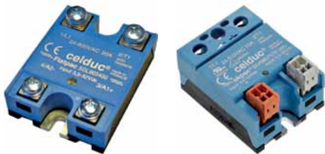
Рис.8. ТТР серии SOL