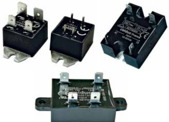
Рис.15. ТТР с плоскими клеммами серий SF, SCF и SP7