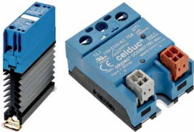
Рис.13. ТТР серий SILD и SOD

обеспечить минимальный занимаемый объем. Реле серий SA/SAL/SAM/SU/SUL/SUM позволяют решать задачи коммутации и развязки в ограниченном пространстве с возможностью монтажа на теплоотводы и прямым подключением дополнительных модулей (например, контроля токов или терморегуляторов ПИД). Также доступны реле с поддержкой функций диагностики серий SILD/SOD.