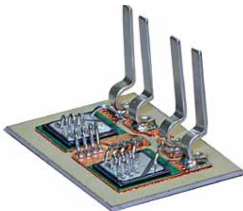
Рис.2. Пример выходного каскада твердотельного реле – тиристор

Компания celduc® relais предлагает одно-, двух- и трехфазные ТТР, которые применяются для управления любыми типами нагрузок. В линейке ТТР представлены устройства, позволяющие реализовать коммутацию практически любого стандартного напряжения с управлением от различных сигналов.