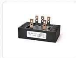
Диодные мосты трёхфазные SQL