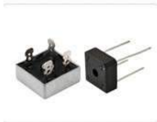
Диодные мосты однофазные KBPC

параметры, маркировка, габариты, фото, аналог, замена