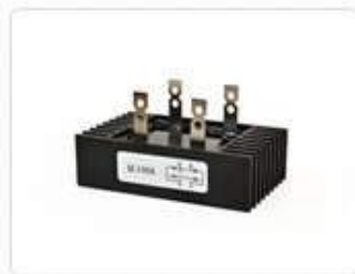
Диодные мосты однофазные QL