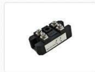
Диодные мосты однофазные MDQ