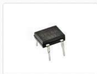
Диодные мосты однофазные DF10M