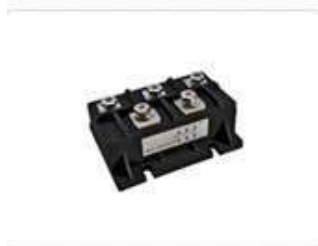
Диодные мосты трёхфазные MDS